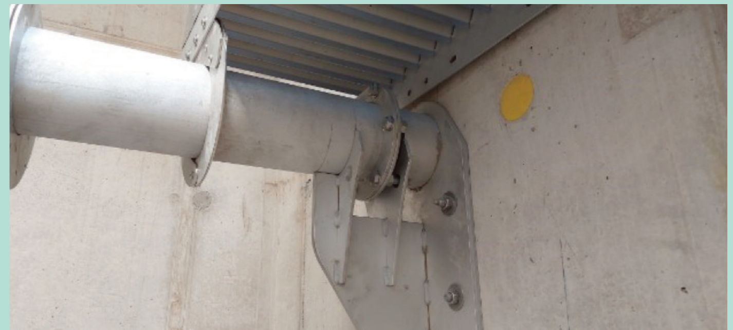
Lagerkonsole von Schrägklärermodulen in einem Regenklärbecken (RKB) des K20 Abschnittes der BAB7 in Hamburg