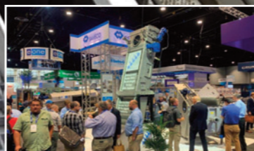
Langfristiges Wachstum und Partnerschaften

Our vision: Improving life with clean air and water