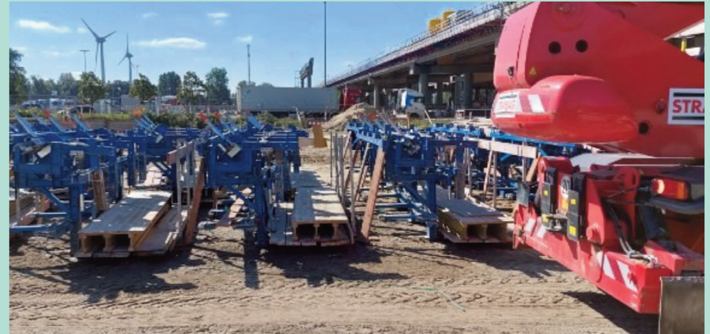
Ablagefläche auf einer Baustelle des K20 Abschnittes der BAB7 in Hamburg

Wassertechnik Spezialist für die Siedlungswasserwirtschaft