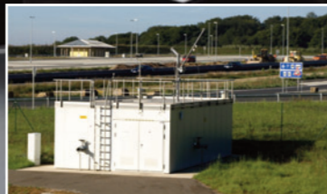
Kläranlage für Autobahn- raststätte