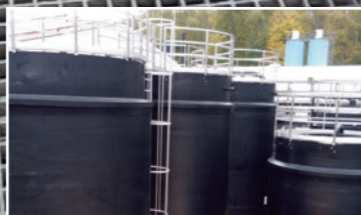
Tanklager für ein Bergbausanierungs- unternehmen