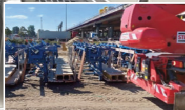
Behandlung von Straßen- abwasser