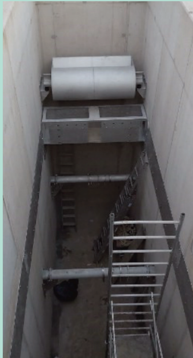
Blick in die Sedimentationskammer eines RKB des K20 Abschnittes der BAB7 in Hamburg (vor Einbau der Schrägklärermodule). Im Hintergrund zu sehen: Spülkippe zur Sohlreinigung des RKB

Die Anwendung von Schrägklärern gilt derzeit als beste technische Maßnahme, um die Abscheideleistung in Durchlaufbecken zu erhöhen. Mit Schrägklärern lassen sich im Jahresmittel bis zu 70% der im Abwasser befindlichen Feinpartikel zurückhalten, was zu einer relevanten Abminderung der Gewässerbelastung beiträgt.