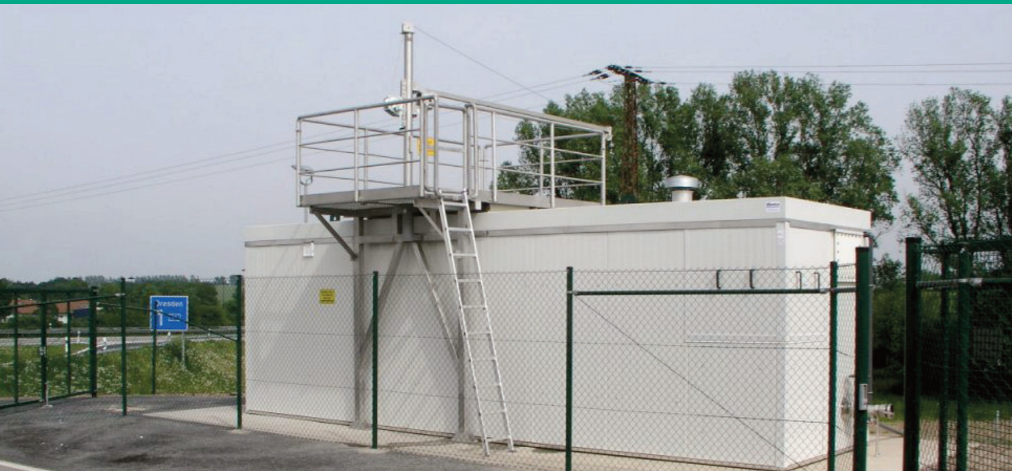
PWC Anlage von Martin Systems an der A72

Nun ist für den Autobahneubau A 49 in Mittelhessen (geplant als Entlastungsautobahn für die parallel verlaufende A7) ebenfalls eine Abwasseraufbereitungsanlage an einem neuen Rastplatze nahe Homburg an der Ohm geplant. Fertigstellung ist im August und Freigabe für die Öffentlichkeit im Oktober 2024.