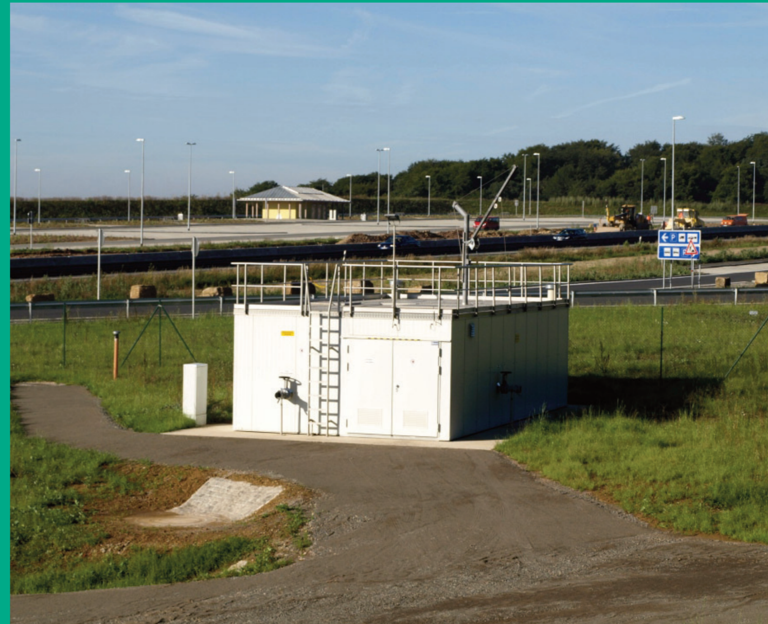
PWC Anlage von Martin Systems an der A3

einer dreistufigen Belebungs-kammer aus Denitrifikations- und Nitrifikationskaskaden, einer Filterkammer mit getauchten Ultrafiltrationsmembranfiltern und einer Überschussschlamm-speicherung. Durch die Membranfiltration können platzsparend hohe Abbauraten und eine hohe Ablaufqualität des gereinigten Abwassers erreicht werden.